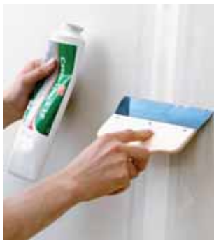
Vid spackling av skarvar mellan gipsskivor förstärk med en pappers- eller glasfiberremsa som sedan överspacklas med Casco Spack LF 3571, Casco Spack LM 3574 eller GipsFiller 3679.