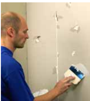
Vid stora hål i gipsvägg spackla med HusFix 3676 eller GipsFiller 3679.