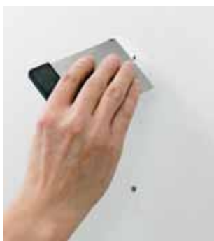
Vid överspackling av skruvskalle använd något utav Cascos väggspackel.